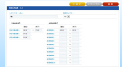
シフトパターン編集画面

勤務形態毎に所定労働時間や休憩時間のマスタ登録、交代勤務などのシフト勤務者にも対応しています。年休の付与や取得状況も確認できます。